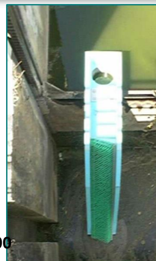
Rallonge de rampe triangulaire RG200 avec équerre CGBR200