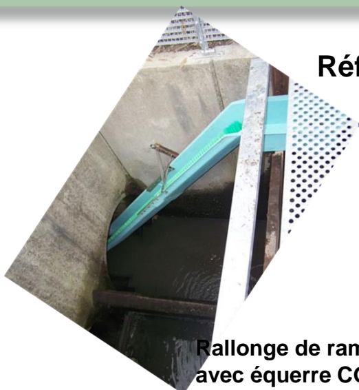
Référence : RG1