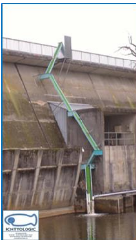
Barrage Rochereau, Lay \Delta h = 11.00 m